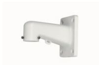
PFB305W Крепление на стену